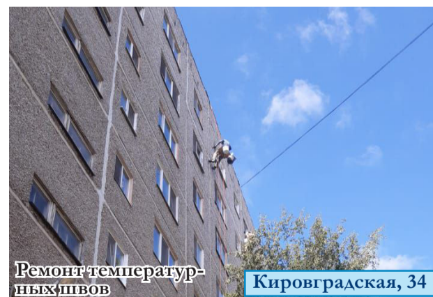
Ремонт температурных швов