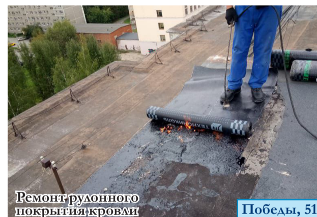
Ремонт рулонного покрытия кровли