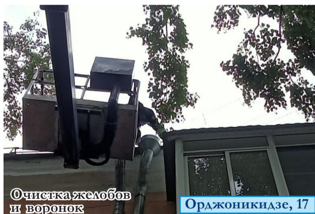
Очистка желобов и воронок