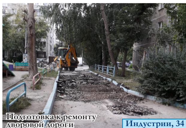
Подготовка к ремонту дворовой дороги